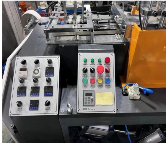
PLC'siz Kontrol Paneli