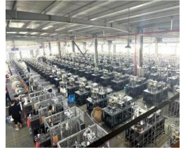
Fabrika Test Alanı