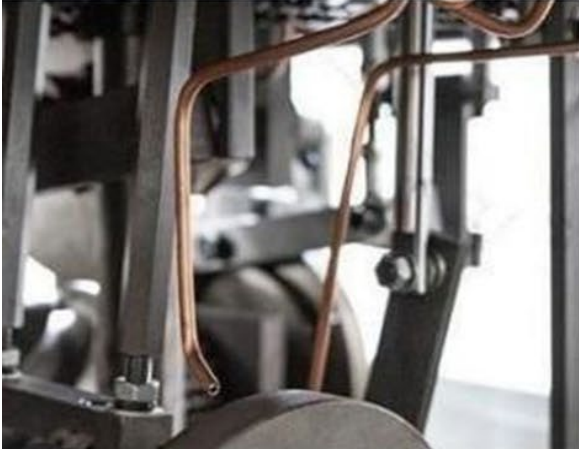
Otomatik Yağlama Sistemi