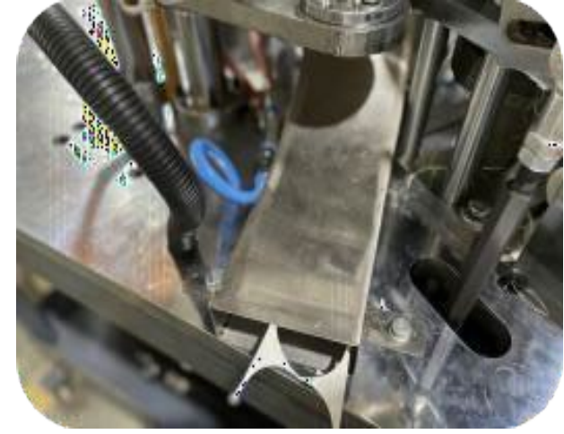
Bıçaklı Alt Taban Kağıt Kesim