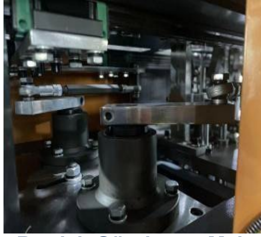
Bardak Gönderme Mek.