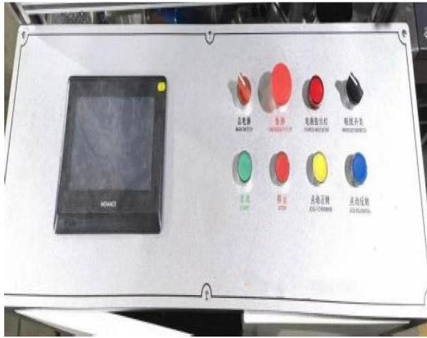
PLC Kontrol Paneli