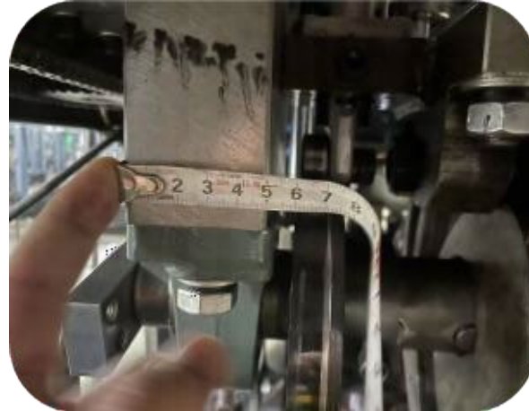
Güçlü Şase, Destek Yapısı