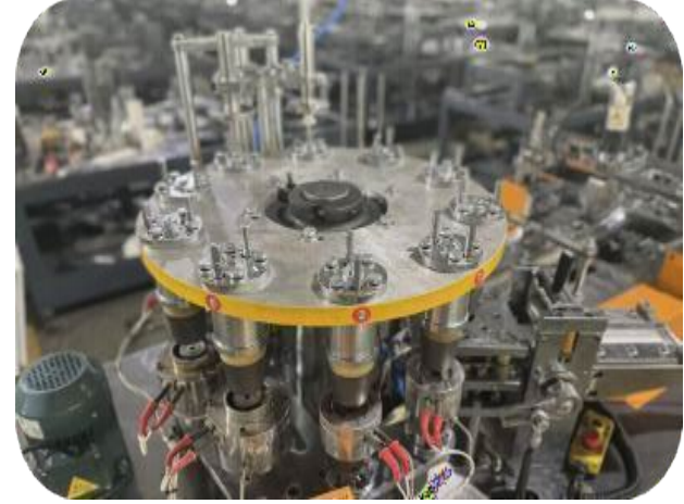
10 Adt. Bardak Kalıbı