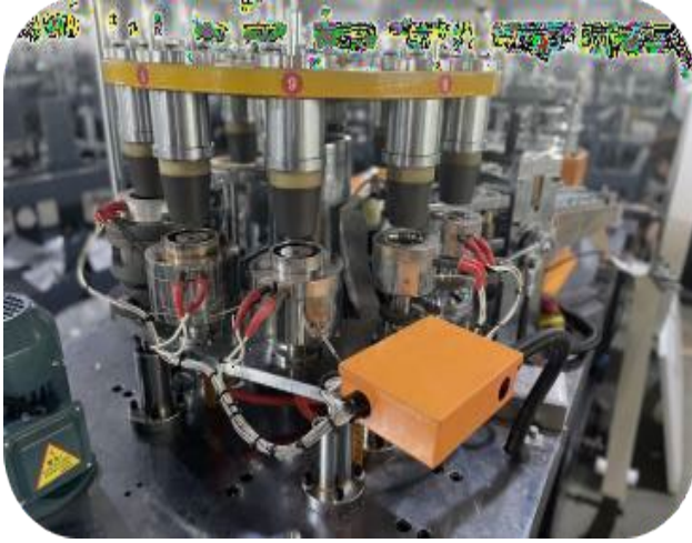
5 adet Isıtma Kalıbı